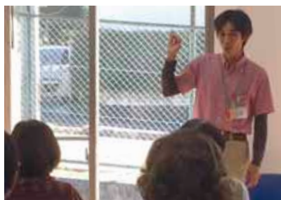
祥雲館「介護教室」 毎月第2月曜日 10時～12時 場所：豊悠福社会別館1階 (参加費200円 お茶菓子付)

平成28年2月18日(木)、希望ヶ丘自治会館で豊能町地域包括支援センターの「介護・出前講座」に参加し、地域の方々と交流させていただきました。 出前講座では、講話・実演、グループワークなどのプログラムがあり、私たちは、「日常生活での介護・介助方法」というテーマで、現場で実際に行っている介護技術を紹介させていただきました。在宅でよくある場面です。在宅でよくある場面です。在宅でよくある場面です。