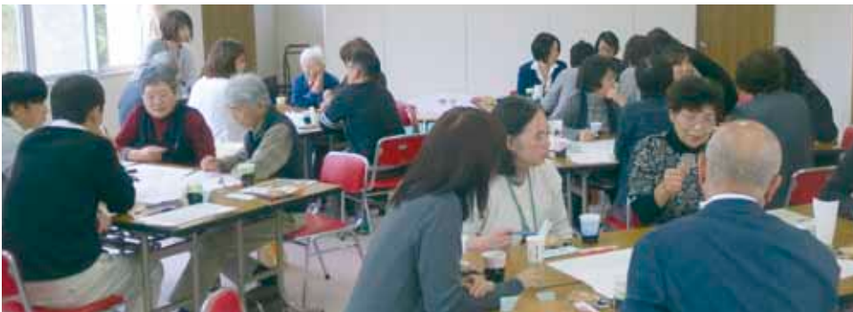
笑雲caféの様子 吉川自治会館にて