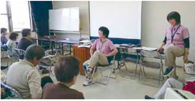
吉川・ときわ台地区福祉委員会 ふれあいサロンでの様子 (2015.10.29)