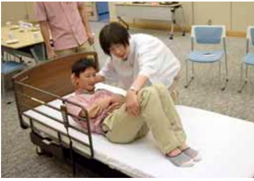
介護講習会：ベッドからの移乗の様子