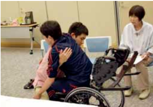
介護講習会：車椅子への移乗の様子

第3次豊能町福祉計画により、豊能町は高齢化率が38%と、大阪府下でも高齢化が進んでいる地域と示されています。高齢化への対策は、様々な視点から検討されるものと思えます。祥雲館では、ささやかな取り組みではありますが、月1回介護教室を開催して