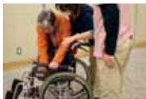
車イスの操作方法の説明

【介護講習会】毎月第2月曜 10時～12時 開催日：4月10日(月)、5月8日(月)、6月12日(月)、7月10日(月) 場所：豊悠福祉会本館2階豊悠ホール(吉川187-1) ※3月より場所が変更になりました。 対象：どなたでも参加OK 内容：祥雲館の介護スタッフ、ケアマネジャーと一緒に車イスの操作など楽しく体験していただきます。 参加費：200円(お茶菓子代) 問合せ：☎072-733-2301 ※「出張介護教室」受付中!!